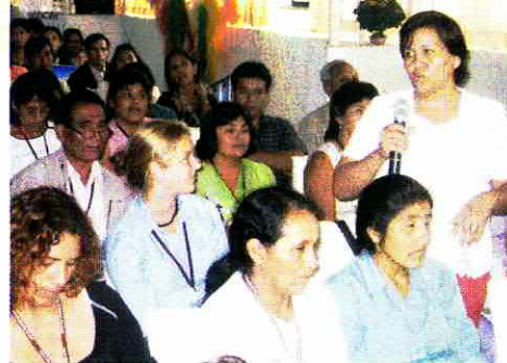
• El Programa Mujer, Género y Familia de la Central COCLA promueve la realización de proyectos productivos como la Cooperativa Sumaq T'anta.

También han diseñado proyectos productivos y de servicios que han entrado a concurso al Proyecto de Desarrollo del Corredor Puno Cusco. Resaltan las experiencias exitosas del programa de promotoras de salud, la cooperativa de servicios múltiples "Sumaq T'anta", y la participación de las mujeres de COCLA en el concurso gastronómico de platos típicos, concurso folklórico de danzas típicas y en el concurso de artesanías andino amazónico.