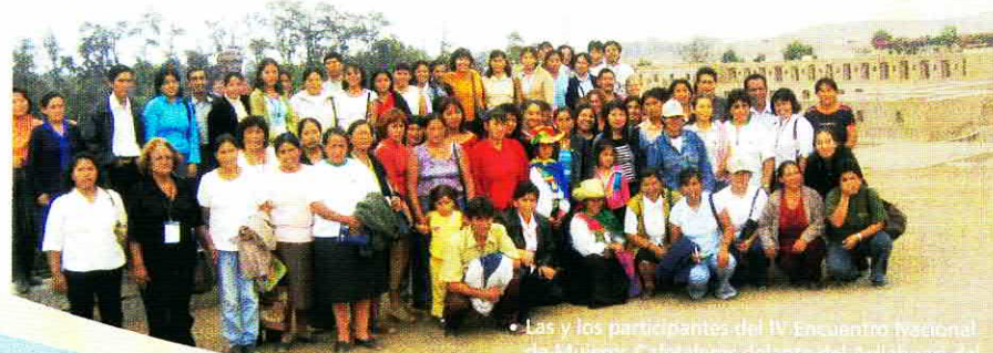
Las y los participantes del IV Encuentro Nacional de Mujeres Cafetaleras delante del Acllahuasi del Santuario de Pachacamac.