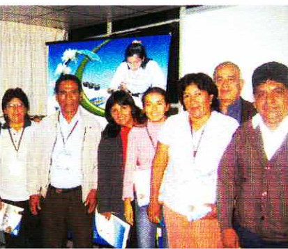
• Delegación de la C.A.C. La Florida, participantes del IV Encuentro Nacional de la Mujer Cafetalera.

Gracias al convenio entre la Asociación La Florida Suiza Perú y la C.A.C. "La Florida" en beneficio del CODEFAM, en 2004, con 82 microcréditos se colocó un monto de