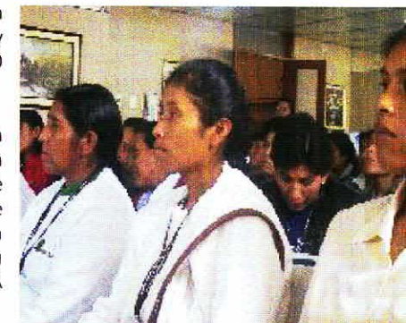
• Delegadas de la Central CECOVASA.

Las mujeres cafetaleras del valle del Sandía participan en tor la producción de café en forma directa. Esta conformada por 8 cooperativas y una asociación de producidas las faenas de producción y cosecha de café; y hasta en el traslado del producto de la chacra a la cooperativa, además de sus tareas en el hogar y su función de madre, esposa y/ hija. CECOVASA tiene 776 socias, según el cuadro adjunto.