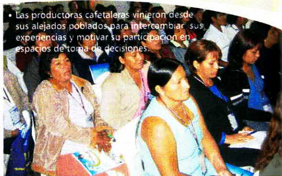
Las productoras cafetaleras vinieron desde sus alejados poblados para intercambiar sus experiencias y motivar su participación en espacios de toma de decisiones.

La encargada de inaugurar el IV encuentro, fue la doctora Lieve Daeren, de FOS de Bélgica, quien resaltó la importancia de este tipo de eventos en el que las mujeres tienen un