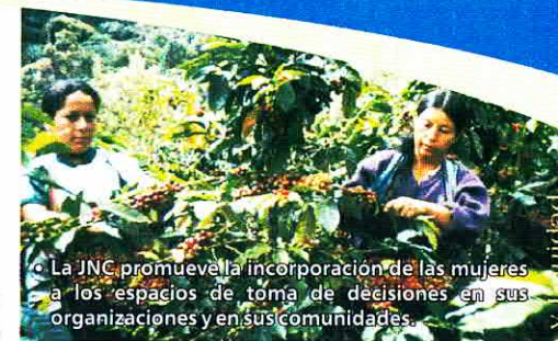
• La JNC promueve la incorporación de las mujeres a los espacios de toma de decisiones en sus organizaciones y en sus comunidades.