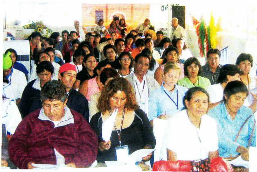
* Representantes de organizaciones del agro, ONGs, entidades financieras, entre otras participaron en el evento de las mujeres cafetaleras.

busquemos el apoyo necesario para el desarrollo de nuestras organizaciones de productores y por ende de la familia cafetalera.