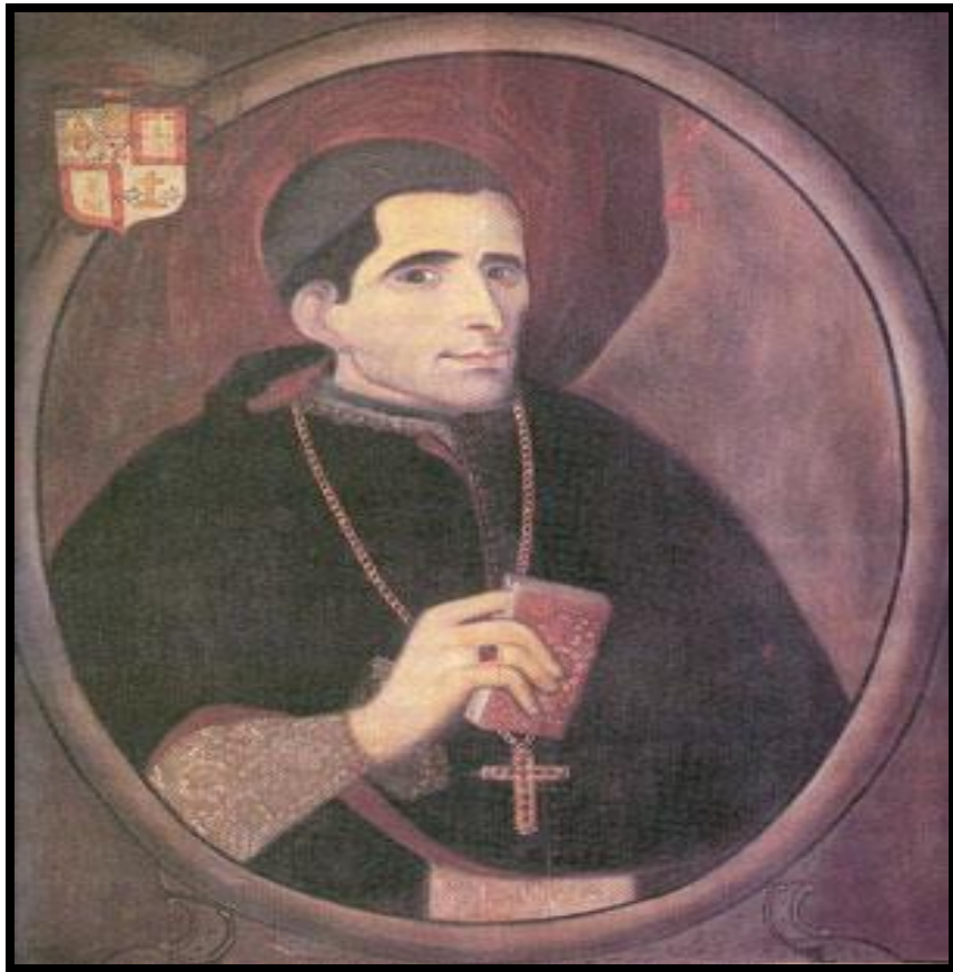
Obispo de Trujillo Martínez de Compañón